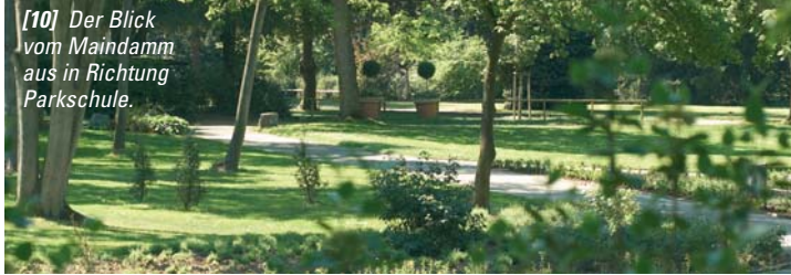
[10] Der Blick vom Maindamm aus in Richtung Parkschule.