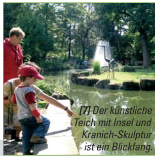
[7] Der künstliche Teich mit Insel und Kranich-Skulptur ist ein Blickfang.