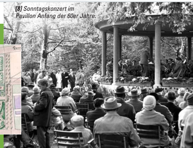
[8] Sonntagskonzert im Pavillon Anfang der 60er Jahre.