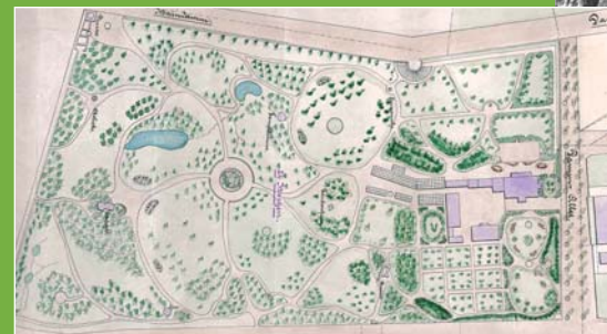
Historischer Plan des Verna-Parks.