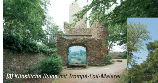
[3] Künstliche Ruine mit Trompé-l'oil-Malerei.