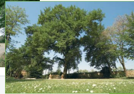
[5] Blick auf die Mauer zum Maindamm: Alte Bäume spenden an der Sitznische Schatten.