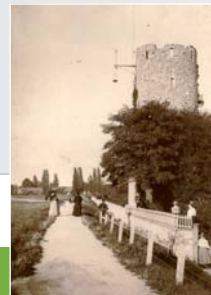
<< Historische Aufnahme der Ruine vom Maindamm aus.

Neuerungen: wo ein runder Platz bereits das Zentrum des Landschaftsgartens bildete, errichtete die Stadtverwaltung den Musikpavillon . Nördlich vom Palais entstand eine Minigolfanlage, und das Gebäude selbst wurde von der Polizei genutzt. In den Sechzigern erhielt die Schule einen Anbau, dem die noch erhaltenen Gewächshäuser weichen mussten. In den Siebzigern schließlich veränderte man geringfügig die Wegeführung, eröffnete in der Eremitage eine Altenbegegnungsstätte, legte einen Spielplatz an und baute das Vogelhaus. Im Palais zog nun das Ordnungsamt ein. Seit einigen Jahren versucht die Stadt Rüsselsheim, den Park wieder seinem ursprünglichen Zustand anzunähern: Obelisk und Sichtachsen wurden frei geschnitten, die Illusionsmalerei an der Burgruine erneuert, und die Fassade der 1994 bei einem Brand stark beschädigten Eremitage wurde wieder hergestellt.