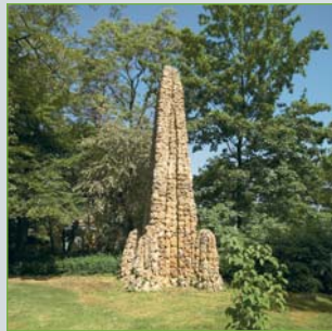
[2] Der mit Muschelkalk verkleidete Obelisk gehört zu den ältesten Bauwerken noch aus der Entstehungszeit des Parks.