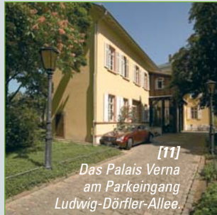
[11] Das Palais Verna am Parkeingang Ludwig-Dörfler-Allee.